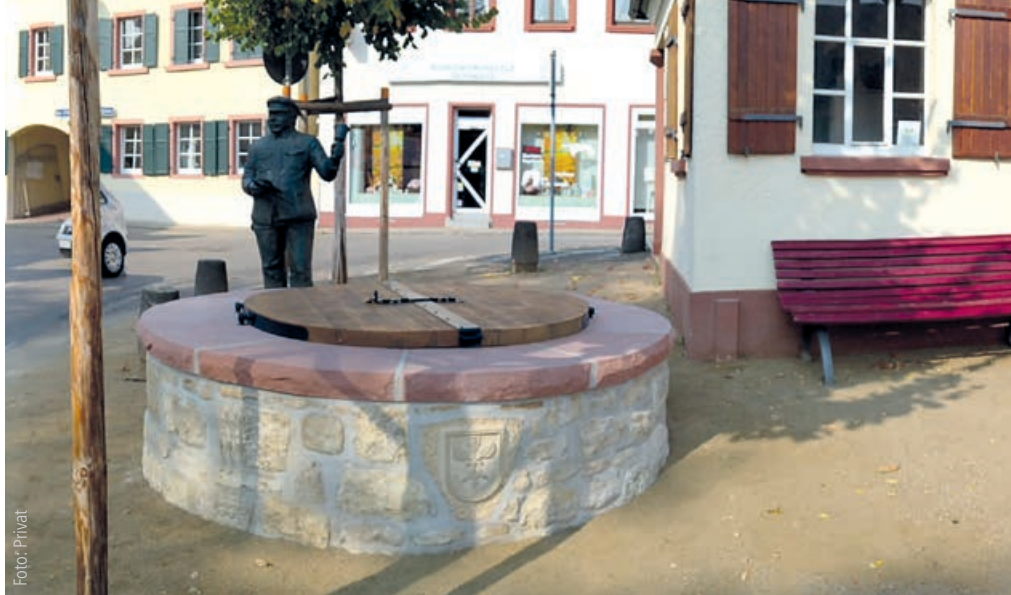
Historischer Rathausbrunnen in Laubenheim: parteiübergreifend und gemeinsam mit Spendenmitteln und ehrenamtlichen Mitarbeitern erfolgreich realisiert.