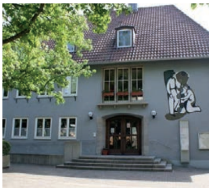
Rathaus Laubenheim