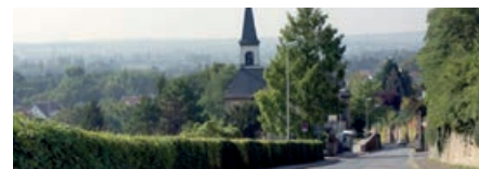
Blick auf Laubenheim