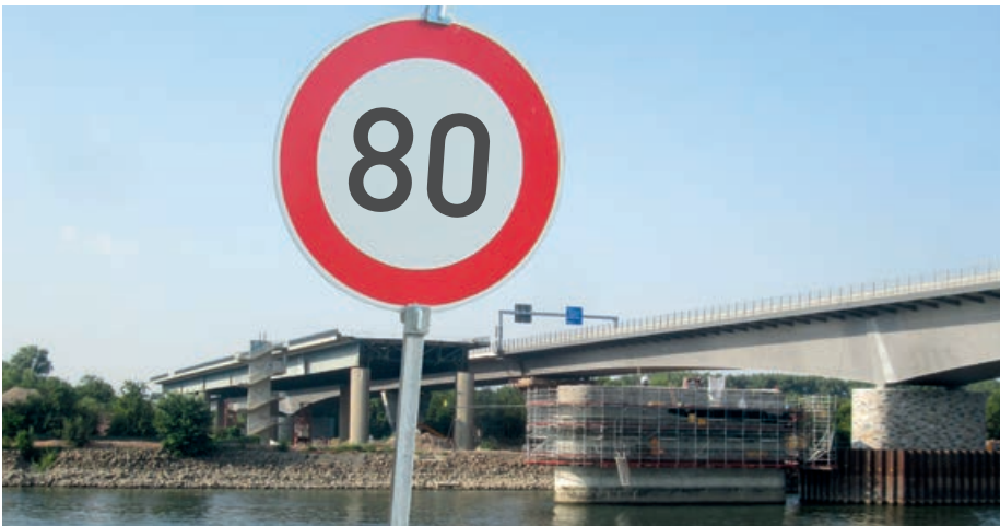
Mombach – A643 im Jahr 2018

Die ÖDP setzt sich seit Jahren für den maßvollen Ausbau der A 643 – sprich, die 4+2-Lösung – ein. Sie ermöglicht, bei hohem Betrieb die Standspuren zu befahren und so eine höhere Kapazität von bis zu 35 Prozent zum Beispiel in den Stoßzeiten am Morgen und am späten Nachmittag im Berufsverkehr zu erreichen. Effektiver Lärmschutz und überdies auch deutlich mehr Verkehrssicherheit könnten – statt durch eine Lärmschutzwand – durch eine