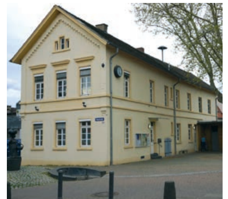
Ortsverwaltung Mombach